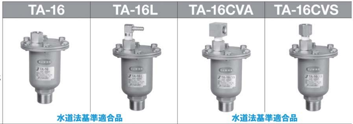
水道法基準適合品